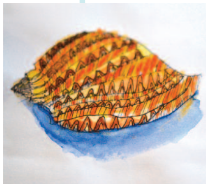
Muséum Requien Croquis d'élève d'un carnet de voyage