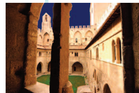
Cloître Benoît XII

De 20h à 24h : dans l'amphithéâtre de la salle du Cellier Benoît XII, présentation de deux films : La construction du Palais des Papes avec des reconstitutions en image en 3 D, Le conclave ou la mort d'un pape avec restitution de l'atmosphère des décors peints du Grand Tinel. Promenade dans le cloître Benoît XII, visite de la salle du Consistoire, de la Chapelle Saint-Jean où seront également présentés deux films sur les décors peints de Simone Martini et de Matteo Giovannetti.