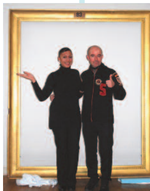
Musée du Petit palais : les gardiens se racontent

De 20h à 24h : visite libre des collections permanentes. Tout au long de la soirée, les gardiens prendront la parole pour vous raconter leur vie au musée, leur rapport aux œuvres et au palais. Rencontres improvisées dans les salles avec le conservateur et son adjointe qui répondront en direct aux questions posées via Internet. Dans le cadre de l'opération La classe, l'œuvre ! lancée par les ministères de l'éducation nationale et de la culture, le service éducatif du musée présentera le travail mené par une école primaire autour d'une œuvre, en présence des élèves. A 20h30 et 22h : sur réservation , la conservation présentera l'histoire du bâtiment et de ses collections.