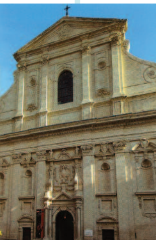
Lapidaire Façade rue de la République